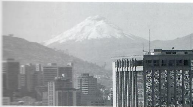
Quito, la capital de Ecuador, con el volcán Cotopaxi.